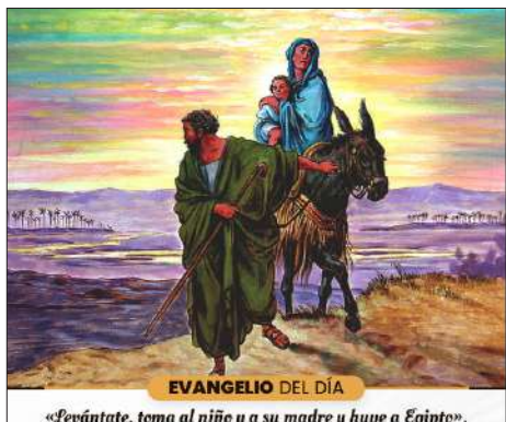
EVANGELIO DEL DÍA «Levántate, toma al niño y a su madre y huye a Egipto».

Diócesis de María Auxiliadora Magallanes - Chile