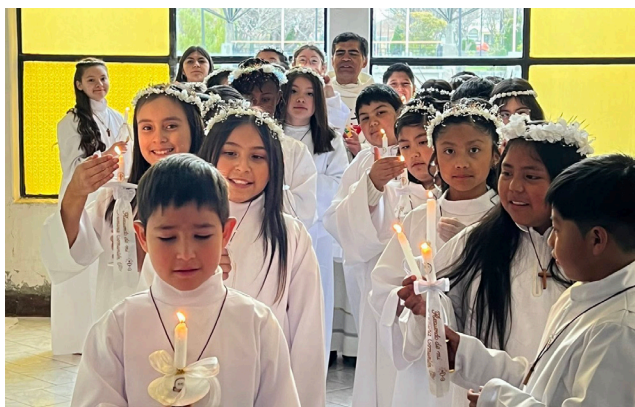
En Tierra del Fuego celebraron su primera comunión 29 niñas y niños en la Parroquia San Francisco de Sales de Porvenir y 5 niños y niñas en la Comunidad San Alberto Hurtado de Cerro Sombrero.