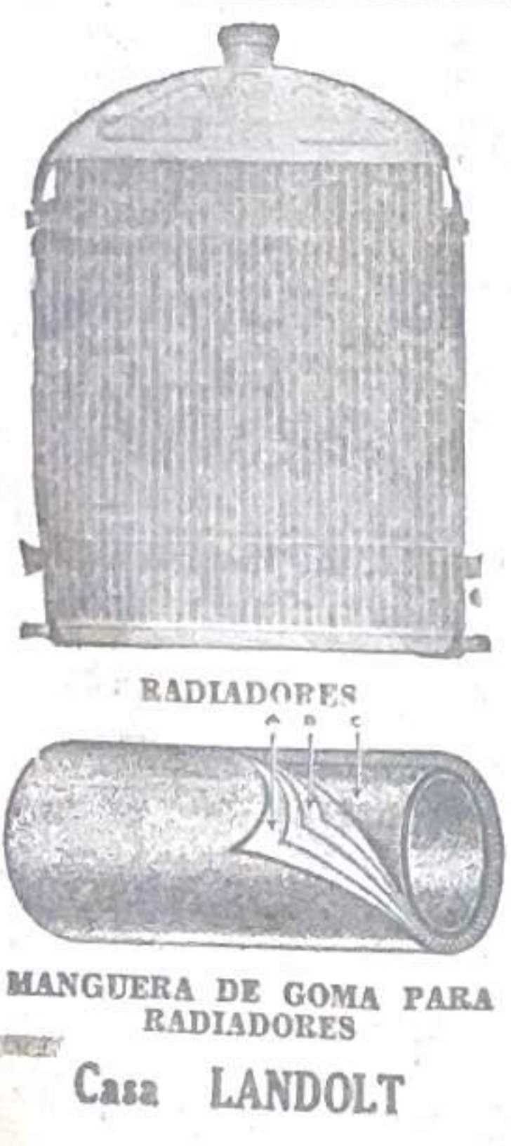
RADIADORES MANGUERA DE GOMA PARA RADIADORES Casa LANDOLT

Osaka, 26. (U.P.)— Llegó a este puerto el buque escuela argentino "La Argentina". El capitán hará las vistas oficiales de estilo.