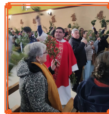
PARROQUIA SAN MIGUEL