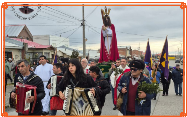
JESUS NAZARENO DE PUNTA ARENAS