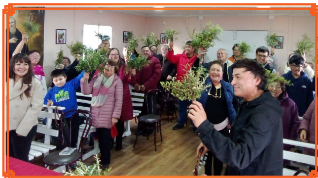
COMUNIDAD CERRO DOTOTEA