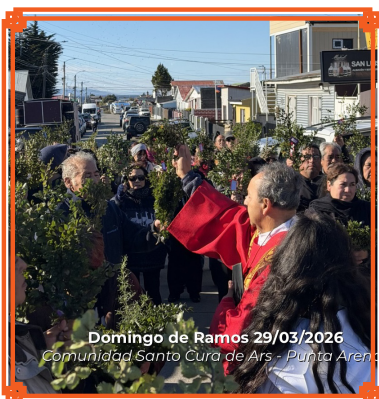
COMUNIDAD SANTO CURA DE ARS