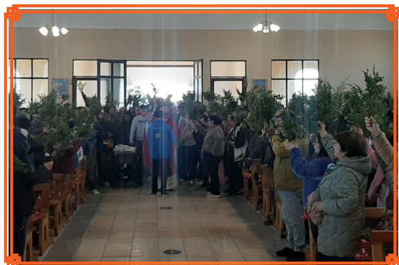
PARROQUIA SANTA TERESA DE LOS ANDES