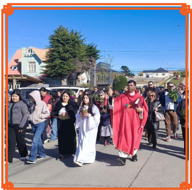
PARROQUIA SAN FRANCISCO DE SALES DE PORVENIR