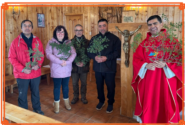
COMUNIDAD DE PAMPA GUANACO