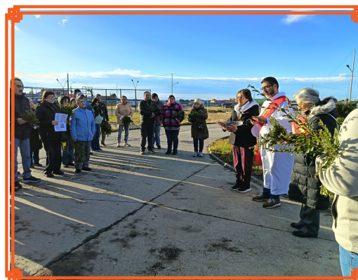
COMUNIDAD VIRGEN DEL CARMEN