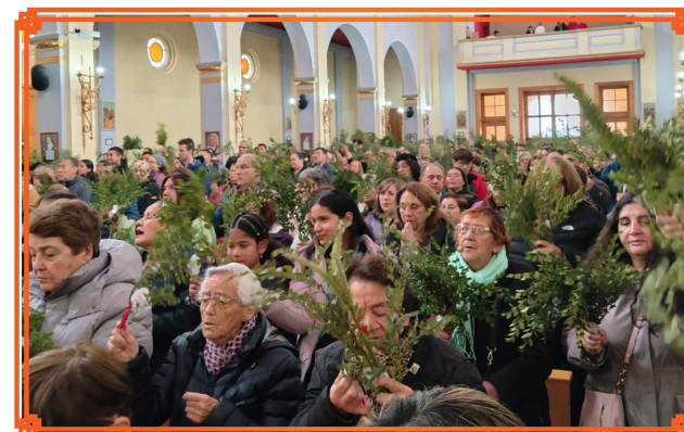
PARROQUIA MARIA AUXILIADORA DE PUERTO NATALES