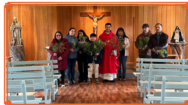
COMUNIDAD DE CAMERON