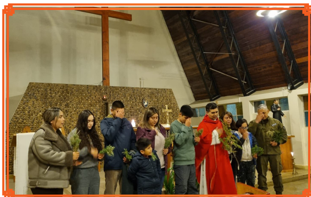
PADRE HURTADO DE CERRO SOMBRERO