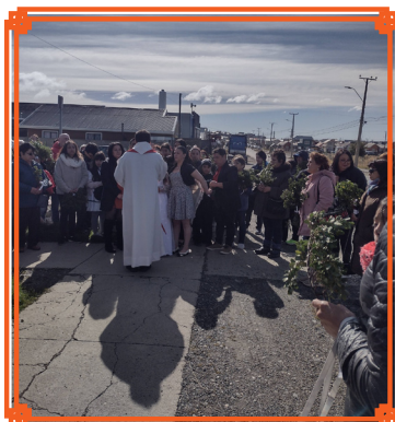
PARROQUIA SAN PIO DE PIETRELCINA